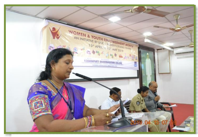
Speech by the Convenor