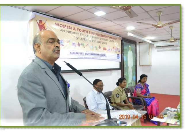
Presidential remarks by Principal