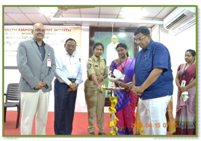
Lighting of the lamp